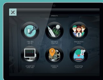
ממשק משתמש קל ונח לתפעול הכולל ניווט גמיש