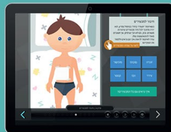
מדף רכואי ורגאשי על שלבי התהליך המוצלג באופן ליניארי וכשאל