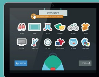
שילוב למידה אקטבית, אינטראקציות, הפגנות ומשחקים

” לא ידעתי שהכבד שאקל כמו בקבוק קולה ” אהבתי שהוכפאם במחלקה חדרים לאיתמר ” איתמר לא לבד כי בוליק וביפ נקדו לו ובאו איתו