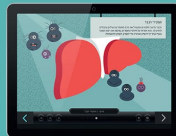
מסגרת מסורות מתאמה לילדים ומדברת בשפתם