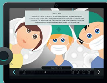
הכרות עם הצוות הדכואי ואיזורי בית החולים