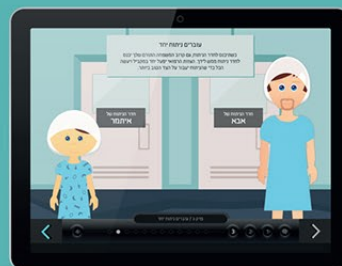
מסלולי תוכן יודים להתאמת תוכנית למידה אישית